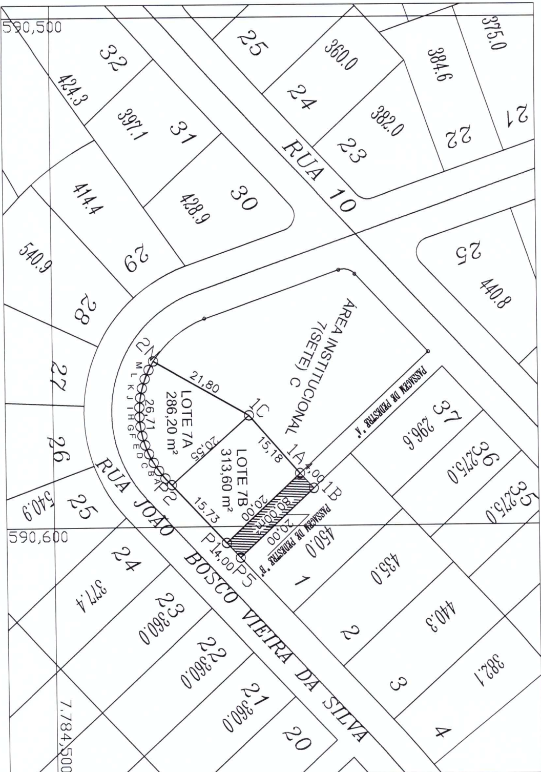
TABELA DE INFORMAÇÃO DE DADOS DA ÁREA DESAFETADA CORRESPONDENTE A ÁREA TOTAL DE 679,80M²

PLANTA PLANIMÉTRICA DA ÁREA DESAFETADA DA ÁREA INSTITUCIONAL 7 (SETE) E PASSAGEM DE PEDESTRE DO BAIRRO SANTA ROSA LOCALIZADO NO MUNICÍPIO DE SARZEDO /MG