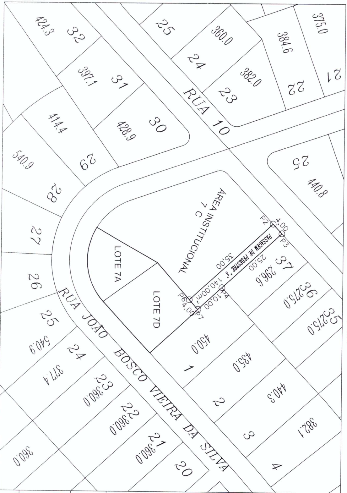
TABELA DE INFORMACAO DE DADOS AREA DE 140,00M² REFERENTE A PASSAGEM DE PEDESTRE A

PLANTA PLANIMETRICA DA AREA REMANESCENTE DA PASSAGEM DE PEDESTRE CONFRONTANTE COM A AREA INSTITUCIONAL 7 (SETE) E COM OS LOTES 01 E 37 DA QUADRA 32 DO BAIRRO SANTA ROSA LOCALIZADA NO MUNICIPIO DE SARZEDO /MG