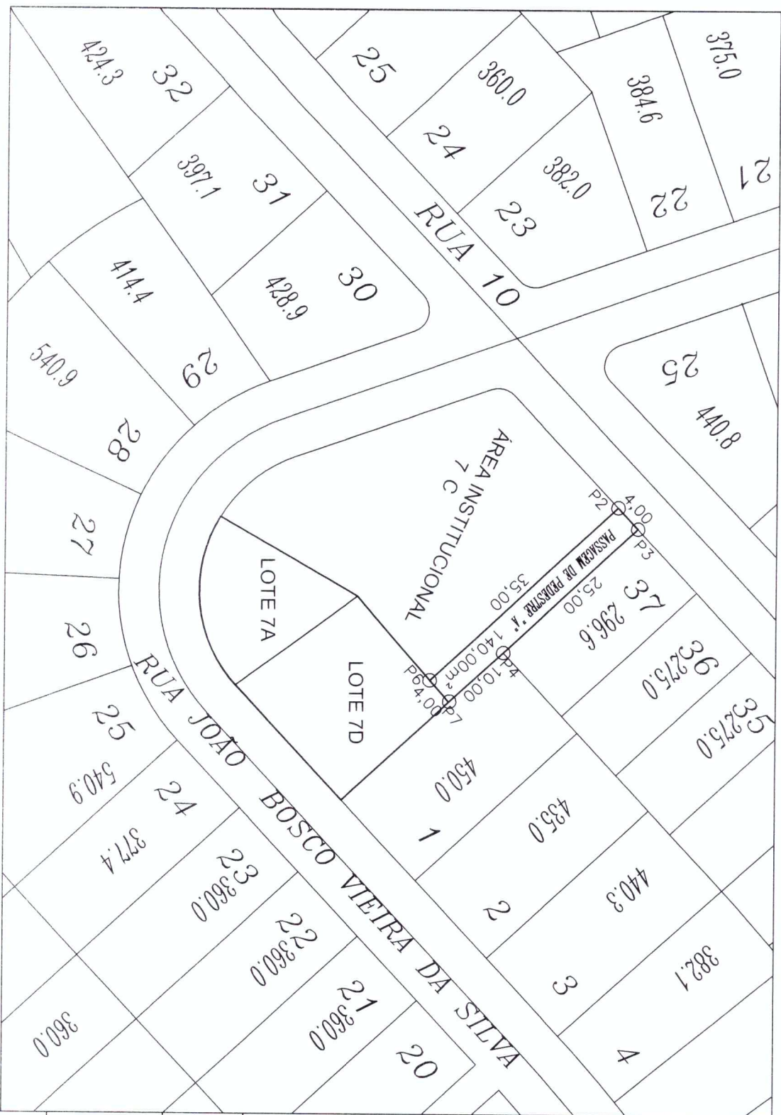
TABELA DE INFORMACAO DE DADOS AREA DE 140,00M² REFERENTE A PASSAGEM DE PEDESTRE 'A'

PLANTA PLANIMETRICA DA AREA REMANESCENTE DA PASSAGEM DE PEDESTRE CONFRONTANTE COM A AREA INSTITUCIONAL 7 (SETE) E COM OS LOTES 01 E 37 DA QUADRA 32 DO BAIRRO SANTA ROSA LOCALIZADA NO MUNICIPIO DE SARZEDO /MG